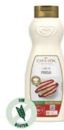
SIROPE DE FRESA Ref.: 11806801 1Kg