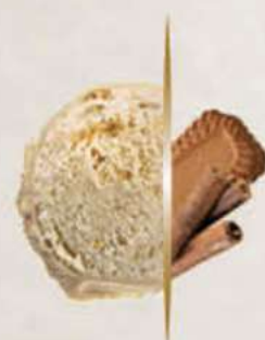
GALLETA SPÉCULOOS Cremoso helado sabor galleta con trocitos de galleta de canela Ref.: 71710 2400 ml - 1200g