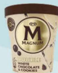
MAGNUM CHOCOLATE BLANCO & COOKIES Ref.: 31563 8 ud./caja - 440 ml - 300 g