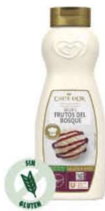
SIROPE DE FRUTAS DEL BOSQUE Ref.: 11806502 1Kg