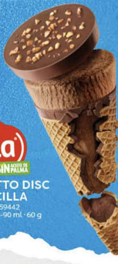
nocilla SIN ACEITE DE PALMA CORNETTO DISC NOCILLA Ref.: 59442 30 ud./caja-90 ml · 60 g