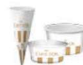
Consumibles Ref.: 3005 cono papel Ref.: 3098 vasito 80ml Ref.: 3081 vasito 200ml