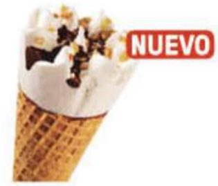
CONO NATA 1 Ref.: 00521 110ml - 60g