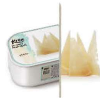
QUESO 1 Ref.: 00149 - 2,5L