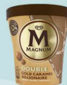
MAGNUM DOUBLE GOLD CARAMEL BILLIONAIRE Ref.: 48045 8 ud./caja - 440ml - 303g