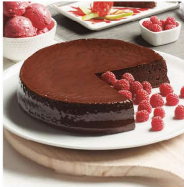
TARTA SACHER 1