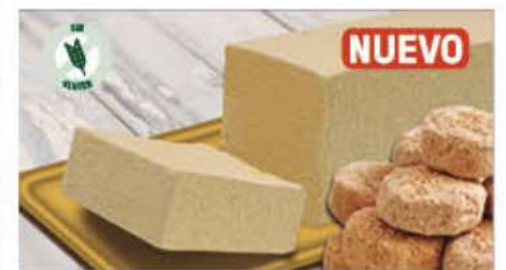
BLOQUE MANTECADO 1 Ref.: 000257 1L