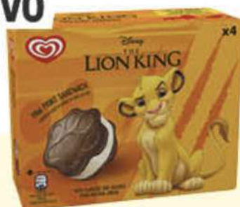
LION KING Ref.: 63336 8 ud./caja - 240ml - 152g