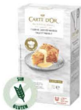
SALSA DE VAINILLA Ref.: 60004501 1L