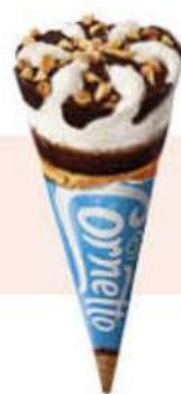
CORNETTO CLASSIC Ref.: 31967