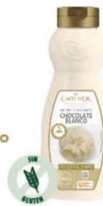
SIROPE DE CHOCOLATE BLANCO CRUJIENTE Ref.: 64307907 1Kg