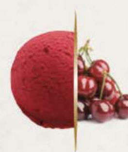
CEREZA Con trocitos de cereza Ref.: 59597 2400 ml - 1560 g