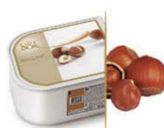
PRALINÉ Ref.: 97694 2,4L - 1200g