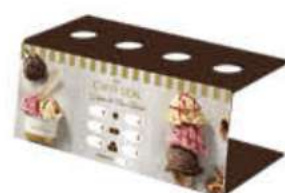
Portaconos Ref.: 41476