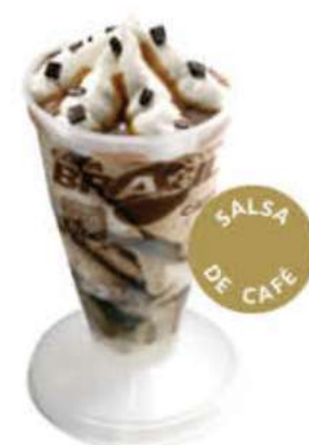
COPA BRASIL Ref.: 94293 125ml - 74g