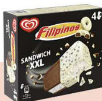
X4 SANDWICH XXL FILIPINOS Ref.: 59767 6 ud./caja 520 ml - 308 g