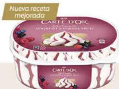
CARTE D'OR YOGUR FRUTAS DEL BOSQUE Ref.: 61958 6 ud./caja - 825ml - 480 g