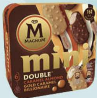
X6 MAGNUM MINI CARAMEL ALMOND & MINI BILLIONAIRE Ref.: 58579 6 ud./caja - 330 ml - 282 g