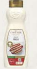
SIROPE FRESA 11806801