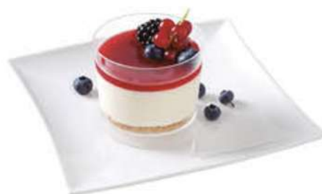
COPA DELICIA CHEESECAKE Ref.: 86817 150ml - 93g