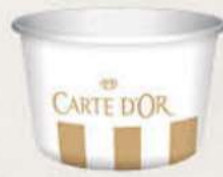
Vasito 200 ml Ref.: 3081