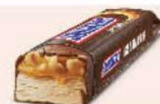
SNICKERS ICE CREAM Ref.: 46087