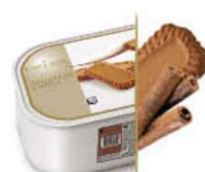
GALLETA SPÉCULOOS Ref.: 71710 2,4L - 1200g