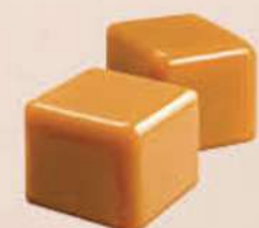
TROCITOS DE CARAMELO