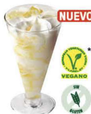
COPA LIMÓN 1 Ref.: 734122 - 160ml