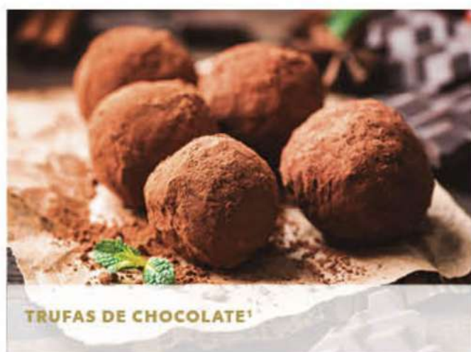
TRUFAS DE CHOCOLATE'