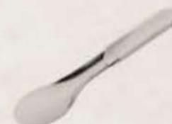
Espátula metálica Ref.: 3095