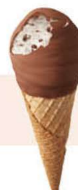
CORNETTO CHOCK'N'BALL Ref.: 54237