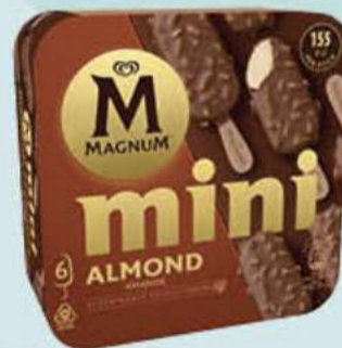
X6 MAGNUM MINI ALMENDRAS Ref.: 63575 Nueva ref.: 61196 6 ud./caja - 330 ml - 276 g