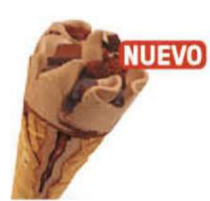
CONO BROWNIE 1 Ref.: 00519 110ml