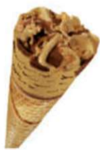
CONO TURRÓN 1 Ref.: 00515 110ml