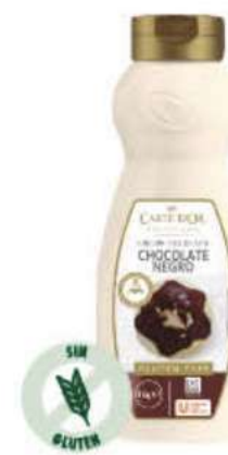
SIROPE DE CHOCOLATE NEGRO CRUJIENTE Ref.: 64307986 1Kg