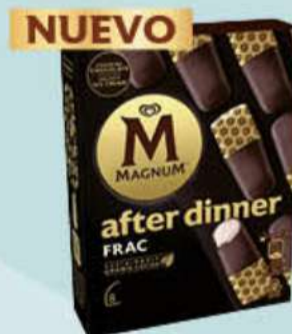
X8 MAGNUM AFTER DINNER FRAC Ref.: 81806 Nueva ref.: 62539 8 ud./caja - 280ml - 232g