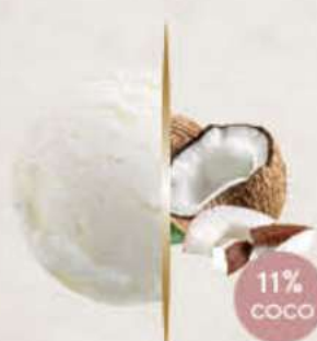
COCO Con coco rallado Ref.: 47782 2400 ml - 1458 g