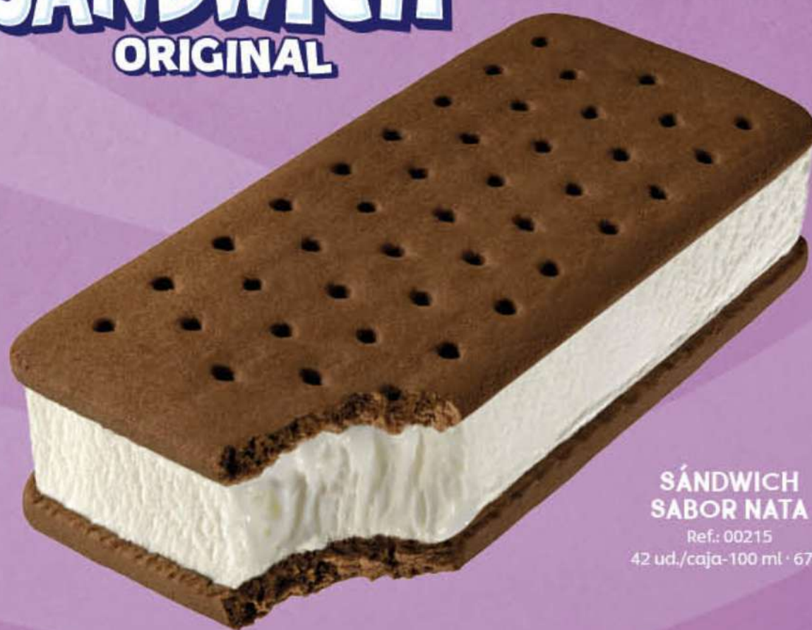
SÁNDWICH SABOR NATA Ref.: 00215 42 ud./caja-100 ml · 67 g