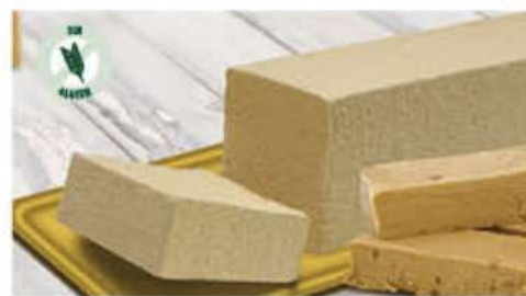
BLOQUE TURRÓN 1 Ref.: 002551 1L