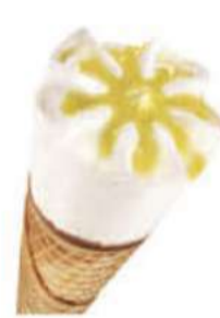
CONO LIMÓN 1 Ref.: 00517 110ml