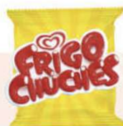
FRIGO CHUCHES - Ref.:64463