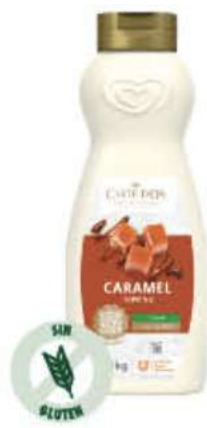
SIROPE DE CAMELO Ref.: 64307111 1Kg