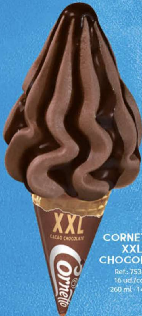
CORNETTO XXL CHOCOLATE Ref.: 75389 16 ud./caja 260 ml · 145 g