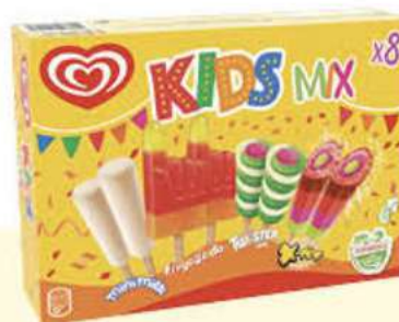
X8 KIDS MIX Ref.: 59249 6 ud./caja 428 ml - 360 g