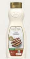
SIROPE CARAMELO 11806001