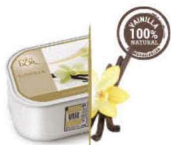
VAINILLA DE MADAGASCAR Ref.: 47401 2,4L - 1200g