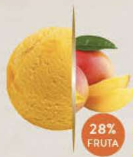
MANGO Con trocitos de mango Ref.: 59632 2400 ml - 1560 g