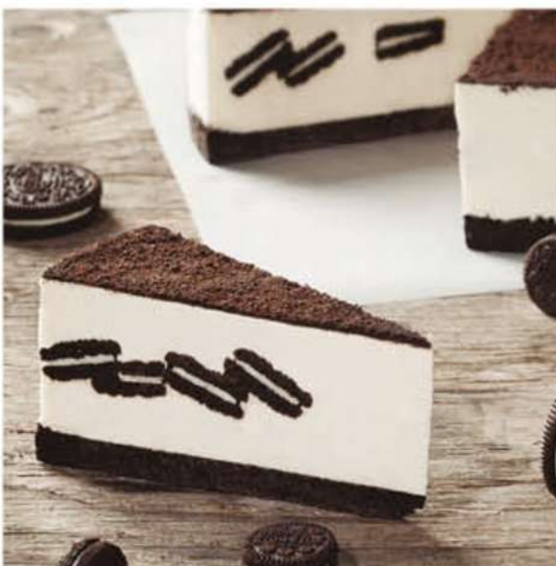
CHEESECAKE OREO (2)