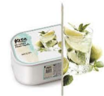
HELADO DE MOJITO 1 Ref.: 00153 - 2,5L