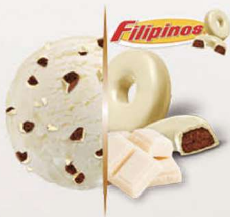
FILIPINOS® (1) Chocolate blanco con filipinos* Ref.: 01170 4500 ml - 2300 g