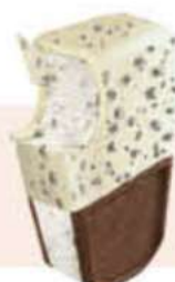
SANDWICH XXL FILIPINOS Ref.: 59745