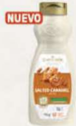
SIROPE SALTED CARAMEL 68535245