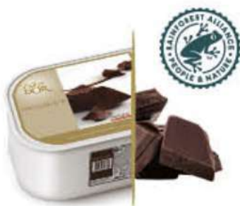
CHOCOLATE NEGRO CON CACAO DE ECUADOR Ref.: 46692 2,4L - 1200g