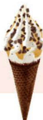
CORNETTO SOFT STRACCIATELLA & CARAMELO Ref.: 62770