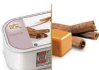
CANELA CON CRUJIENTES DE CARAMELO Ref.: 97563 2,4L 1200g