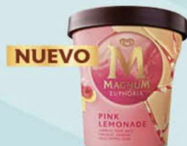
MAGNUM EUPHORIA Ref.: 62198 8 ud./caja - 440ml - 311g