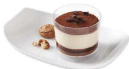
COPA DELICIA TIRAMISÚ Ref.: 86864 150ml - 87g