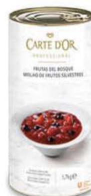
FRUTAS DEL BOSQUE Ref.: 387275 1,7Kg