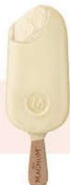
MAGNUM CHOCOLATE BLANCO Ref.: 51810 Nueva ref.: 61297