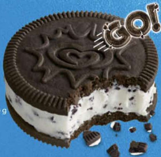
CORNETTO GO! Ref.: 64101 33 ud./caja-110 ml · 66 g