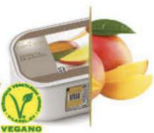
MANGO Ref.: 59632 2,4L - 1560g