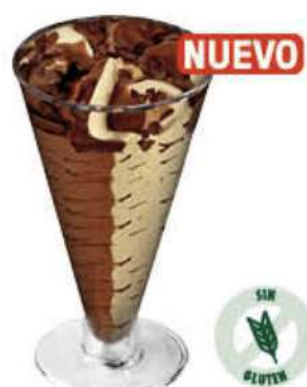
COPA DUO VAINILLA Y CHOCOLATE 1 Ref.: 734112 - 160ml