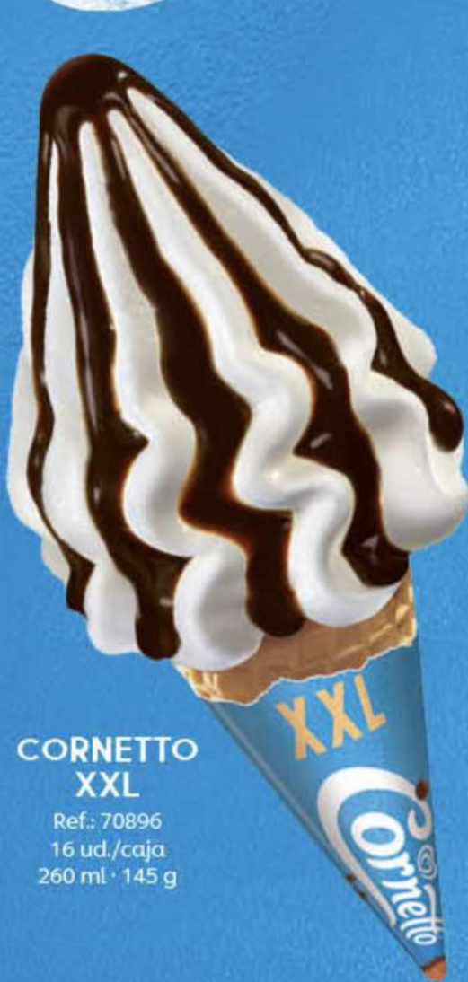
CORNETTO XXL Ref.: 70896 16 ud./caja 260 ml · 145 g

CORNETTO®: MARCA Nº1 EN VENTAS DE CONOS**