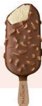
MAGNUM ALMENDRAS Ref.: 51860 Nueva ref.: 60935