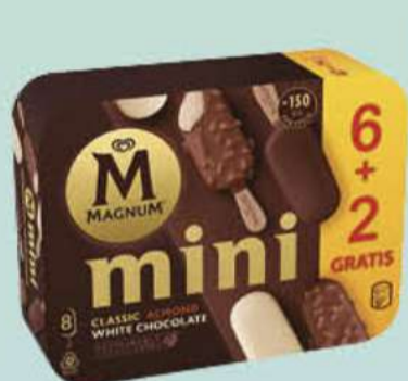
X8 MAGNUM MINI SURTIDO PROMO Ref.: 61089 6 ud./caja - 440 ml - 352 g

Consumo de Llevar a casa, venta incremental