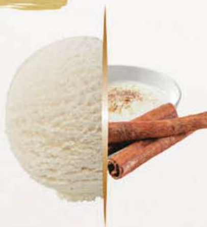
LECHE MERENGADA (1) Leche merengada con canela Ref.: 01160 4500 ml - 2250 g

(1) Estas referencias se distribuyen bajo la marca FRIGO RESTAURACIÓN, marca registrada por UNILEVER y distribuida por CRESTAS LA GALETA, S.A. Avda. Valdeparra, Nº3. 28108 ALCOBENDAS (Madrid) ESPAÑA. Teléfono de atención al cliente: 910 37 89 98 (©) La marca Filipinos® bajo licencia de GALLETAS ARTIACH, S.A.U.