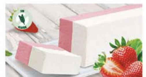
BLOQUE SABOR NATA FRESA 1 Ref.: 002531 1L