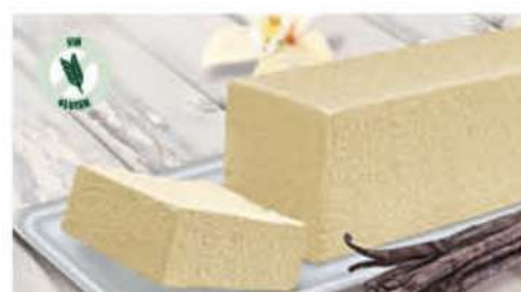
BLOQUE SABOR VAINILLA 1 Ref.: 002511 1L