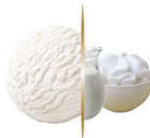
NATA Ref.: 38100 5L - 2450g