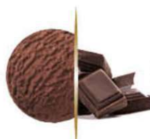
CHOCOLATE Ref.: 02075 5L - 2600g