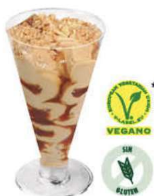
COPA TURRÓN SELECTO 1 Ref.: 734111 - 160ml