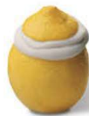
LIMÓN HELADO Ref.: 70382 130ml - 80g