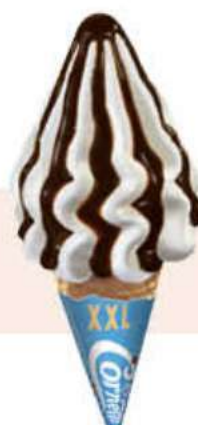
CORNETTO XXL Ref.: 70896