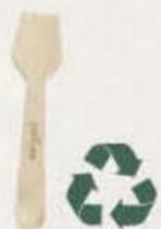
Cucharita madera Ref.: 3101