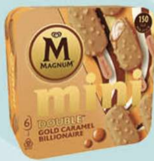
X6 MAGNUM MINI GOLD CARAMEL BILLIONAIRE Ref.: 48509 6 ud./caja - 330 ml - 264 g