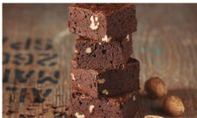
BROWNIE CON NUECES'

Ref.: 58842 - Plancha 1700g / 24 unidades