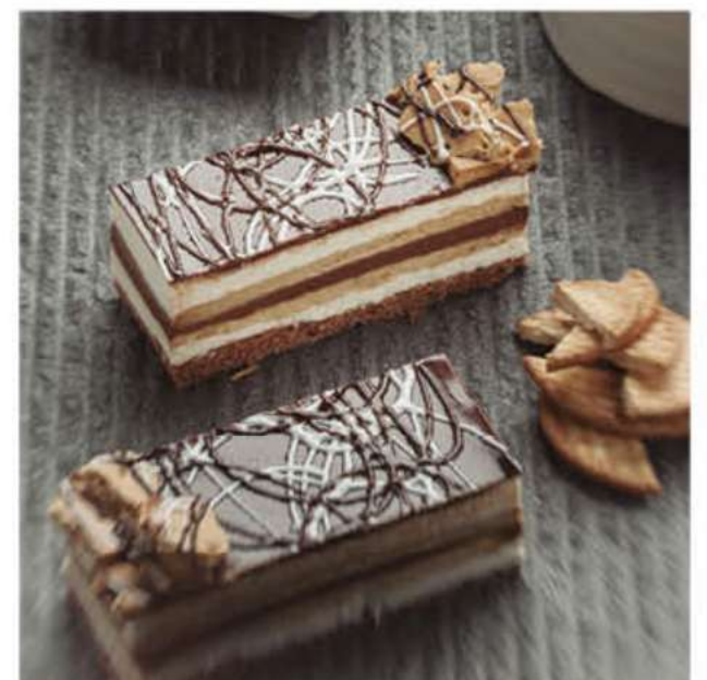
TARTA DE LA ABUELA 1 (NO PRECORTADA)