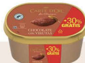
CARTE D'OR CHOCOLATE PROMO Ref.: 54606 6 ud./caja - 1300 ml - 650 g