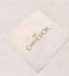
Servilletas Ref.: 3008