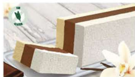
BLOQUE TRES GUSTOS 1 Ref.: 002541 1L