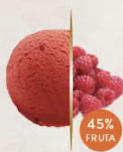
FRAMBUESA Con trocitos de frambuesa Ref.: 59641 2400 ml - 1560 g