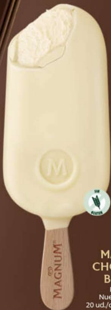
MAGNUM CHOCOLATE BLANCO Ref.: 51810 Nueva ref.: 61297 20 ud./caja - 110ml - 79g