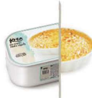
CRÈME BRÛLÉE 1 Ref.: 00155 - 2,5L