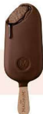
MAGNUM DOUBLE CHOCOLATE Ref.: 57798