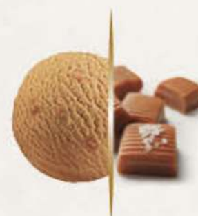
CARAMELO SALADO Helado de caramelo con un toque de sal Ref.: 46694 2400 ml - 1243 g