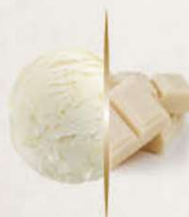
CHOCOLATE BLANCO Helado de fino chocolate blanco Ref.: 97613 2400 ml - 1200 g