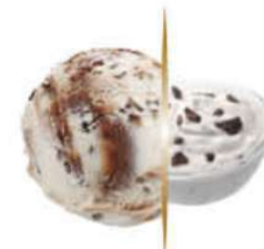
STRACCIATELLA Ref.: 03253 5L - 2450g