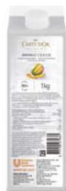
COULIS DE MANGO Ref.: 67945201 1Kg