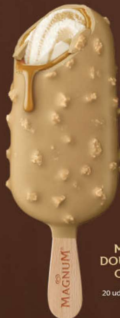
MAGNUM DOUBLE GOLD CARAMEL Ref.: 48054 20 ud./caja-85 ml · 71 g