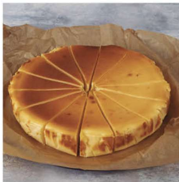
TARTA DE QUESO ESTILO VASCA 1