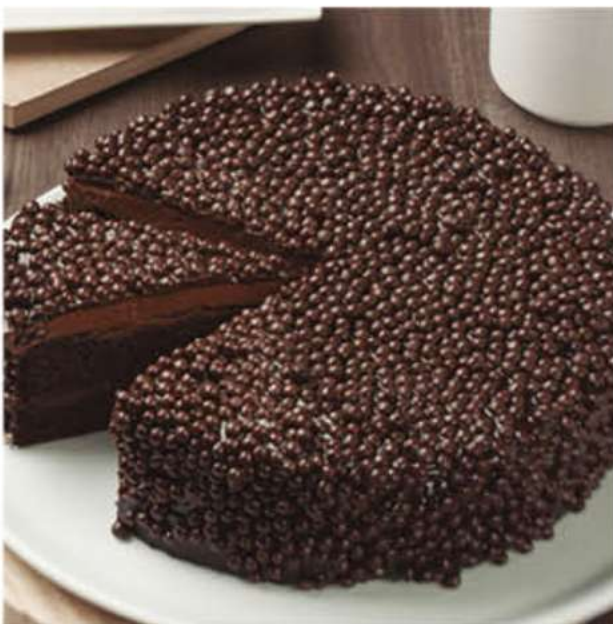
MUERTE POR CHOCOLATE 1