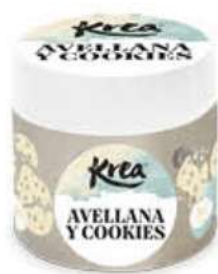
KREA AVELLANA Y COOKIES 1 Ref.: 00198 150ml