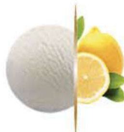
SORBETE LIMÓN Ref.: 63898 5L - 2940g