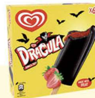
X6 DRÁCULA COLA Ref.: 91130 6 ud./caja 324 ml - 300 g