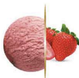
FRESA Ref.: 03241 5L - 2680g