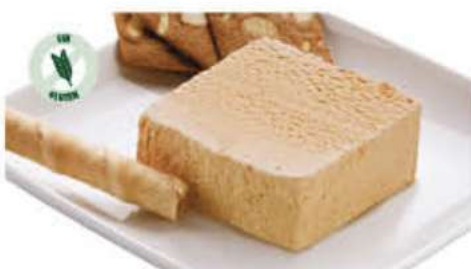
BLOQUE TURRÓN SELECTO 1 Ref.: 002561 1L