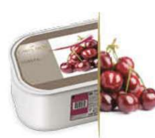
CEREZA Ref.: 59597 2,4L - 1560g