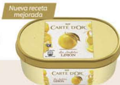
CARTE D'OR SORBETE LIMÓN Ref.: 63719 6 ud./caja - 1000ml - 500 g