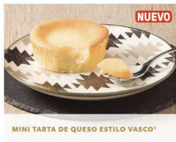
MINI TARTA DE QUESO ESTILO VASCO'