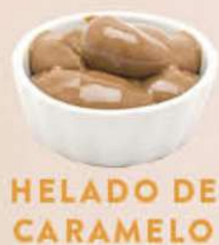
HELADO DE CARAMELO