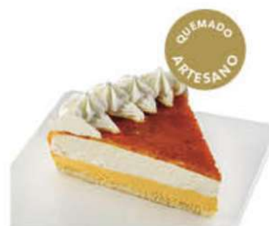
TARTA AL WHISKY CON NATA