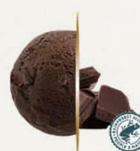
CHOCOLATE NEGRO CON CACAO DE ECUADOR Con chocolate del 70% de cacao Ref.: 46692 2400 ml - 1320 g