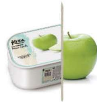
SORBETE DE MANZANA GRANNY SMITH 1 Ref.: 00152 - 2,5L