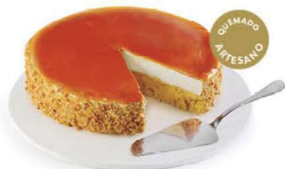
TARTA AL WHISKY Y QUEMADO ARTESANO