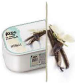
VAINILLA BOURBON 1 Con extracto de vainilla Bourbon de Madagascar Ref.: 00140 - 2,5L