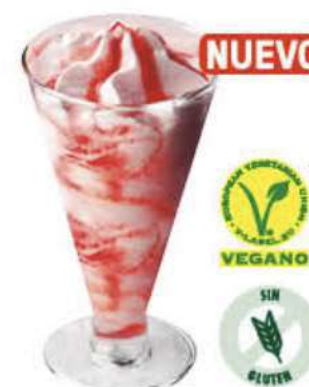
COPA FRESA 1 Ref.: 734103 - 160ml