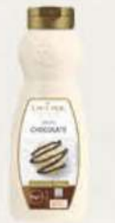
SIROPE CHOCOLATE 11806101