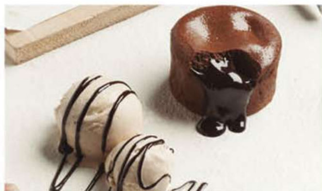
COULANT DE CHOCOLATE'