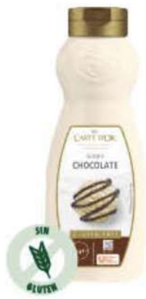
SIROPE DE CHOCOLATE Ref.: 64307114 1Kg