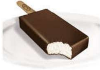
BOMBÓN Ref.: 61927 100ml - 56g