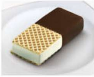
DOMINÓ Ref.: 12159 90ml - 50g