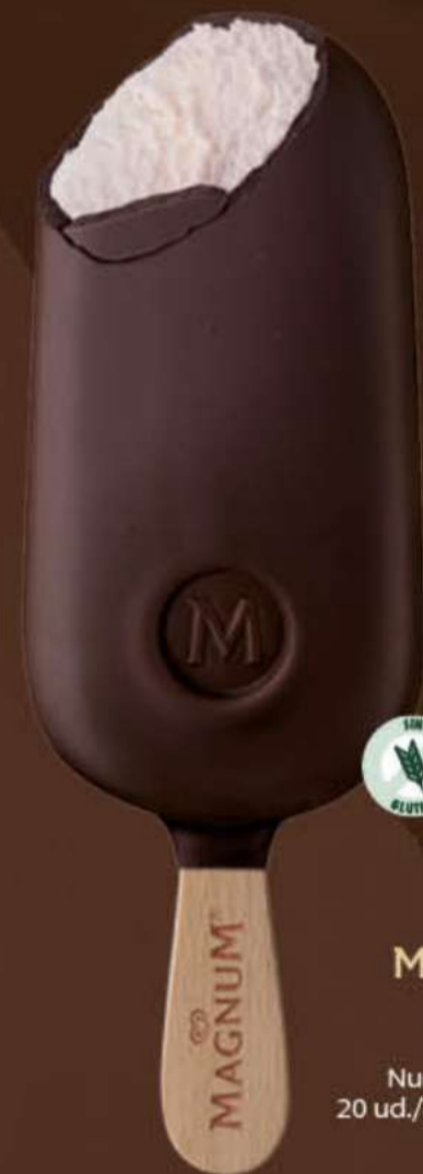
MAGNUM FRAC Ref.: 90174 Nueva ref.: 62874 20 ud./caja - 110ml - 73g