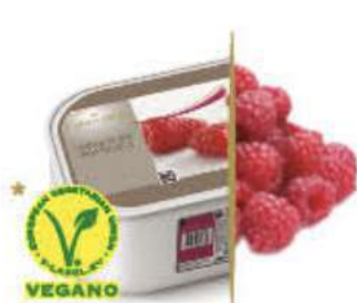
FRAMBUESA Ref.: 59641 2,4L - 1560g