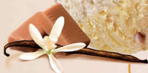
HELADO SABOR VAINILLA CARTE D'OR