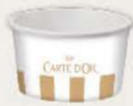
Vasito 175 ml Ref.: 3013