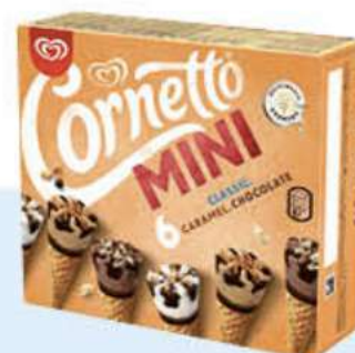
X6 CORNETTO MINI MIX Ref.: 72065 5 ud./caja 360 ml - 216 g