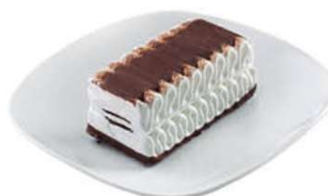
MINI COMTESSA Ref.: 32493 125ml - 64g