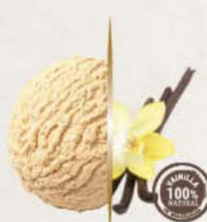
VAINILLA DE MADAGASCAR Con vainas de vainilla Ref.: 47401 2400 ml - 1257 g