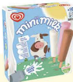
X10 MINIMILK Ref.: 57424 10 ud./caja 350ml - 230 g