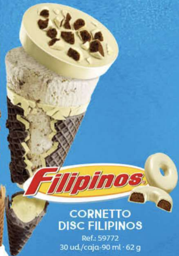
Filipinos CORNETTO DISC FILIPINOS Ref.: 59772 30 ud./caja-90 ml · 62 g