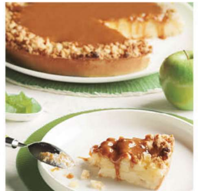
TARTA DE MANZANA CON CARAMELO 1