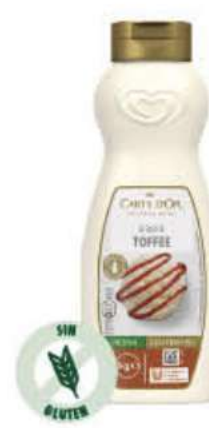
SIROPE DE TOFFEE Ref.: 64318294 1 Kg