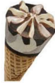
CONO VAINILLA- CHOCOLATE Ref.: 71464 110ml - 60g