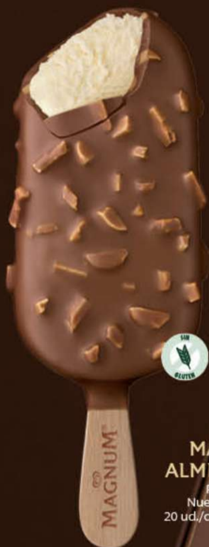
MAGNUM ALMENDRADO Ref.: 51860 Nueva ref.: 60935 20 ud./caja - 110ml - 83g