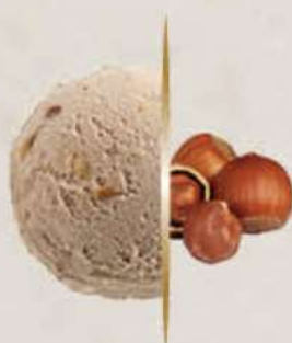
PRALINÉ Con trocitos de avellanas caramelizadas Ref.: 97694 2400 ml - 1200 g