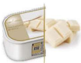
CHOCOLATE BLANCO Ref.: 97613 2,4L - 1560g