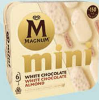
X6 MAGNUM MINI WHITE Ref.: 63606 Nueva ref.: 60972 6 ud./caja - 330 ml - 267 g