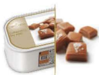
CARAMELO SALADO Ref.: 46694 2,4L - 1560g