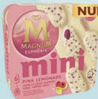
X6 MAGNUM MINI EUPHORIA Ref.: 62222 6 ud./caja - 330ml - 258g