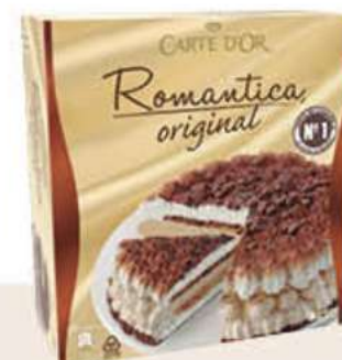
CARTE D'OR TARTA ROMÁNTICA Ref.: 39571 6 ud./caja 1000 ml - 575 g