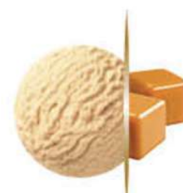
CARAMELO Ref.: 38110 5L - 2550g