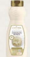
SIROPE CRUNCHY CHOCOLATE BLANCO 67708979