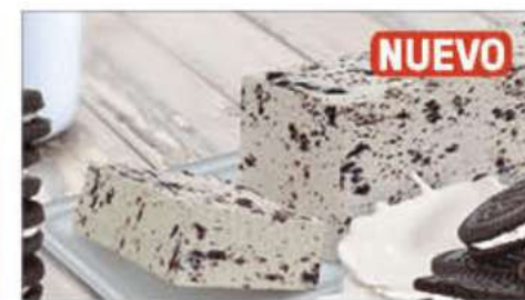
BLOQUE NATA CON GALLETAS AL CACAOS 1 Ref.: 000258 1L