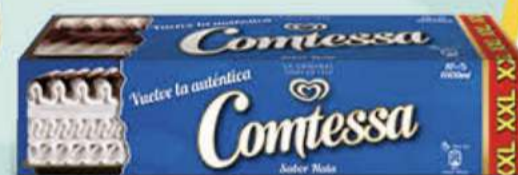
COMTESSA Ref.: 32314 4 ud./caja - 1000 ml - 500 g