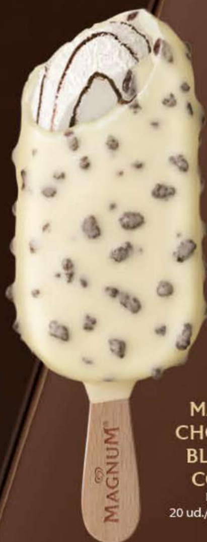
MAGNUM CHOCOLATE BLANCO & COOKIES Ref.: 69162 20 ud./caja-90 ml · 74 g