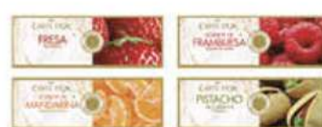
Etiquetas sabores Ref.: 41557