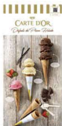
Cartel exterior Carte D'Or Ref.: 41591