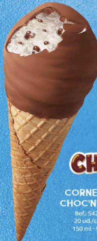
CHOC'N'BALL CORNETTO CHOC'N'BALL Ref.: 54237 20 ud./caja 150 ml · 91 g