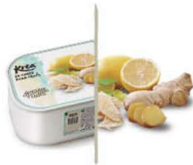
JENGIBRE CONFITADO Y LIMÓN 1 Ref.: 00148 - 2,5L