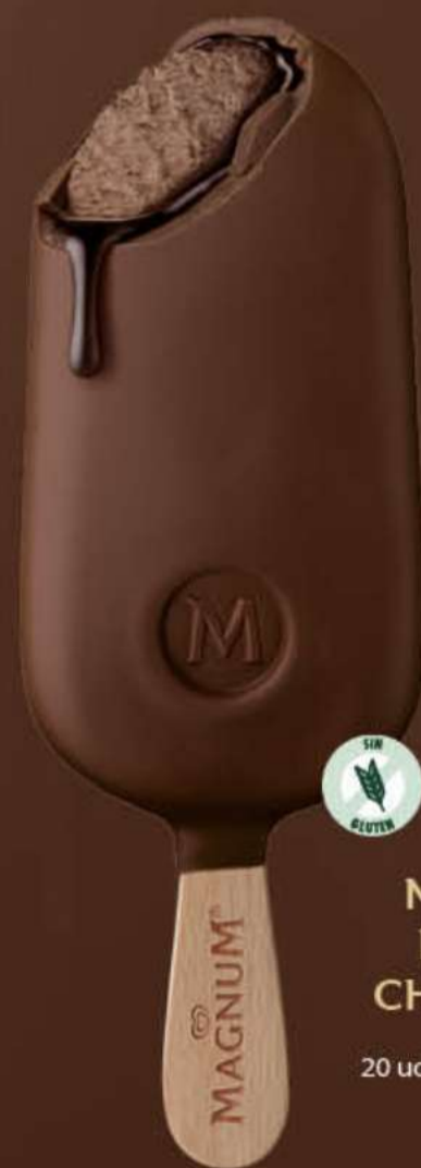
MAGNUM DOUBLE CHOCOLATE Ref.: 57798 20 ud./caja-85 ml · 71 g