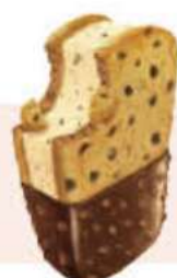
SANDWICH XXL COOKIES Ref.: 64136