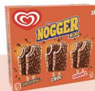
X6 NOGGER Ref.: 39051 6 ud./caja 546 ml - 386 g