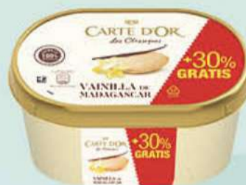
CARTE D'OR VAINILLA PROMO Ref.: 54478 6 ud./caja - 1300 ml - 622 g