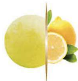
LIMÓN Ref.: 38660 5L - 2450g