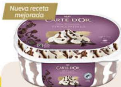
CARTE D'OR STRACCIATELLA Ref.: 62102 6 ud./caja - 825ml - 473 g