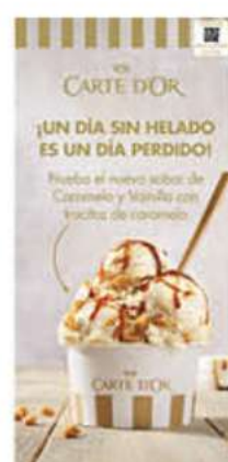
Cartel Novedades Carte D'Or Ref.: 41639