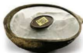
COCO HELADO Ref.: 60118 130ml - 70g