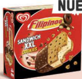
SANDWICH FILIPINOS COOKIES Ref.: 64204 6 ud./caja - 520ml - 308 g