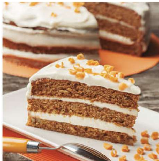
CARROT CAKE AMERICAN STYLE 1