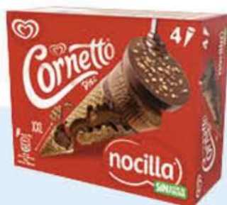
X4 CORNETTO DISC NOCILLA Ref.: 59346 6 ud./caja 360 ml - 240 g