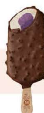
MAGNUM CHILL Ref.: 62287