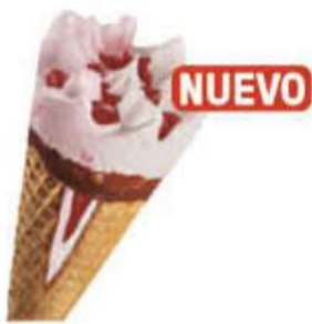
CONO NATA FRESA 1 Ref.: 00522 110ml