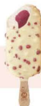
MAGNUM EUPHORIA Ref.: 62229