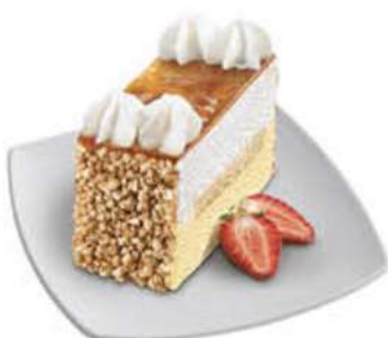
TARTA AL WHISKY RECTANGULAR