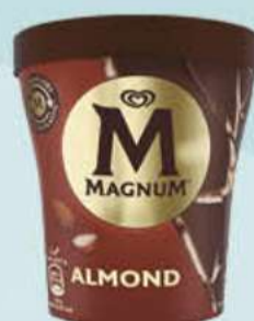
MAGNUM ALMENDRADO Ref.: 56323 8 ud./caja - 440ml - 297g