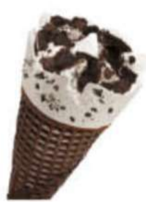
CONO COOKIES 1 Ref.: 00516 110ml