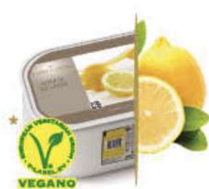
LIMÓN Ref.: 39807 2,4L - 1560g