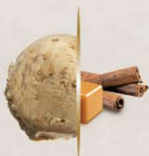
CANELA CON CRUJIENTE DE CARAMELO Helado crema de canela con trocitos de caramelo crujiente Ref.: 97563 2400 ml - 1224 g