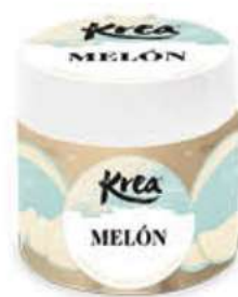
KREA SORBETE MELÓN 1 Ref.: 00196 150ml