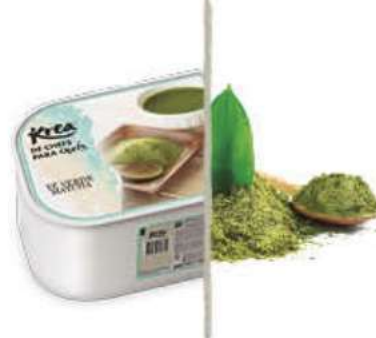
TE VERDE MATCHA 1 Ref.: 00158 - 2,5L