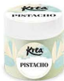
KREA PISTACHO 1 Ref.: 00195 150ml