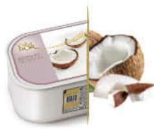
COCO Ref.: 47782 2,4L - 1200g