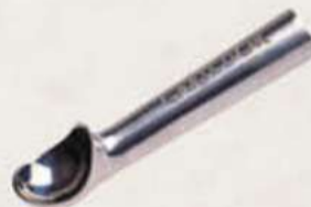
Cuchara térmica T16 Ref.: 3017 T20 Ref.: 3018 T24 Ref.: 3011