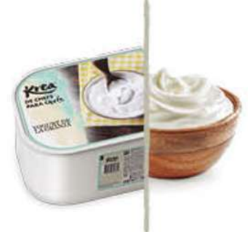
YOGURT 1 Con piñones tostados Ref.: 00156 - 2,5L