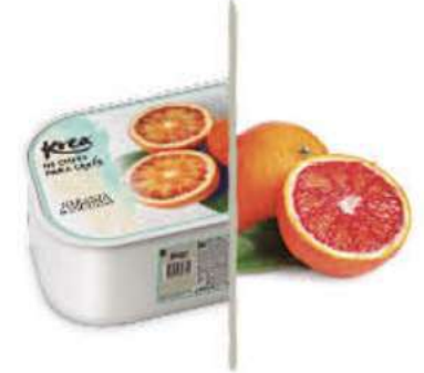
NARANJA SANGUINA 1 Ref.: 00157 - 2,5L