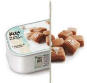
CARAMELO SALADO 1 Ref.: 00144 - 2,5L