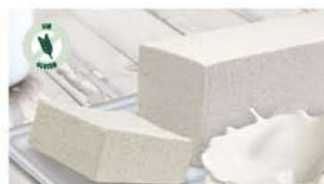
BLOQUE SABOR NATA 1 Ref.: 002521 1L