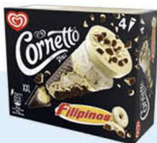
X4 CORNETTO DISC FILIPINOS Ref.: 59777 6 ud./caja 360 ml - 248 g