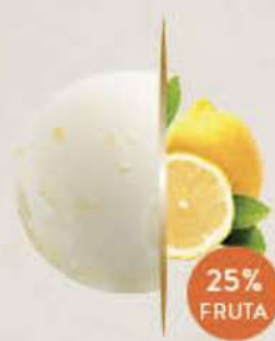
LIMÓN Con trocitos de limón Ref.: 39807 2400 ml - 1560 g