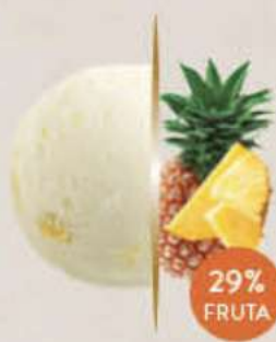
PIÑA TROPICAL Con trocitos de piña Ref.: 59693 2400 ml - 1560 g