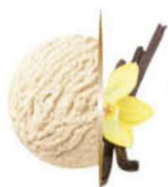
VAINILLA Ref.: 39580 5L - 2475g