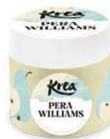
KREA SORBETE PERA WILLIAMS 1 Ref.: 00197 150ml