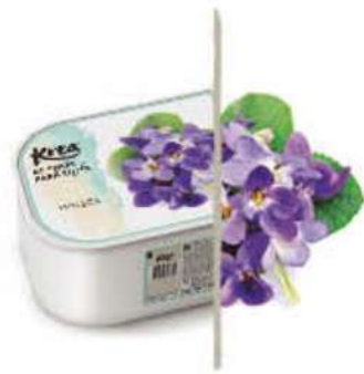
VIOLETA 1 Ref.: 00154 - 2,5L