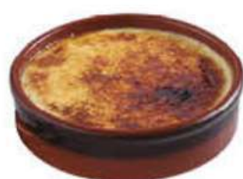
CREMA CATALANA Ref.: 62749 150ml - 84g