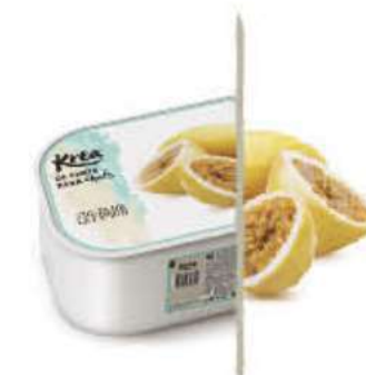
FRUTA DE LA PASIÓN 1 Ref.: 00142 - 2,5L