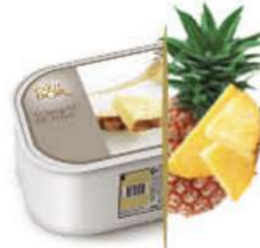
PIÑA TROPICAL Ref.: 59693 2,4L - 1560g