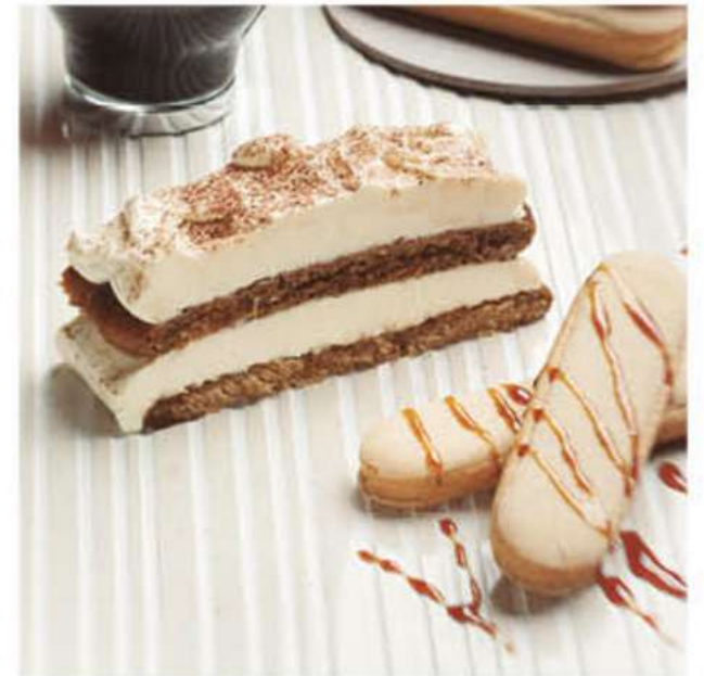
TIRAMISÚ VENETO 1