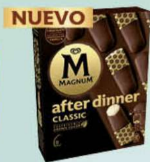
X8 MAGNUM AFTER DINNER CLASSIC Ref.: 57657 Nueva ref.: 62492 8 ud./caja - 280ml - 232g