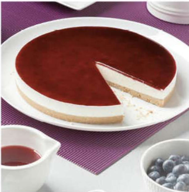
TARTA QUESO ARÁNDANOS 1