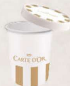
Tarrina 500ml Ref.: 3032 Tapa 500ml Ref.: 3036