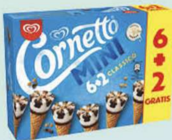
X6 CORNETTO MINI CLASSICO PROMO Ref.: 76022 7 ud./caja 480 ml - 288 g